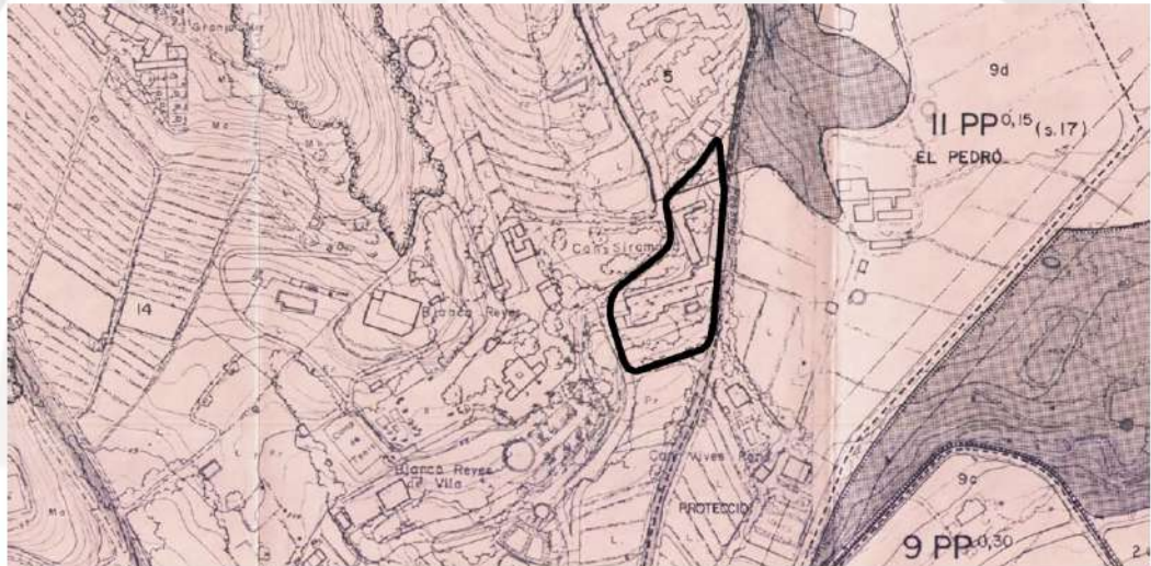
Imatge parcial del plànol núm.2 de les NNSS-1986 amb indicació de la parcel·la 9422601DG5092S0000FU.